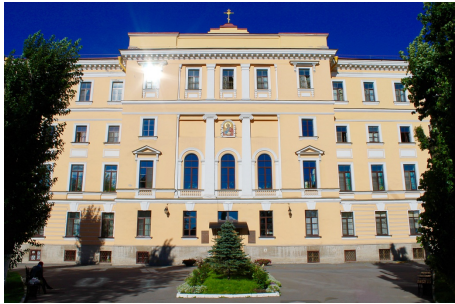
Το κτίριο της Εκκλησιαστικής Πνευματικής Ακαδημίας της Αγίας Πετρούπολης

Εισαγωγή και μετάφραση : Κωνσταντίνου Ν. Θώδη, συγγραφέα - ιστορικού ερευνητή της Μικράς Ασίας του Αιγαίου