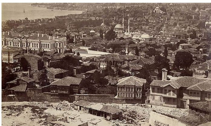
Η Κωνσταντινούπολη στα τέλη του 19ου αιώνα

Des Eriphanios von Cypern "Εκθεσις πρωτοκλησιών πατριαρχών τε και μητροπολιτών" armenisch und griechisch herausgegeben von Fr. Nikolaus Finck.